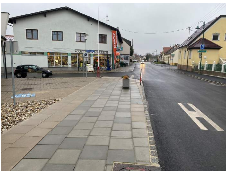
Vorgesehner Behindertenparkplatz