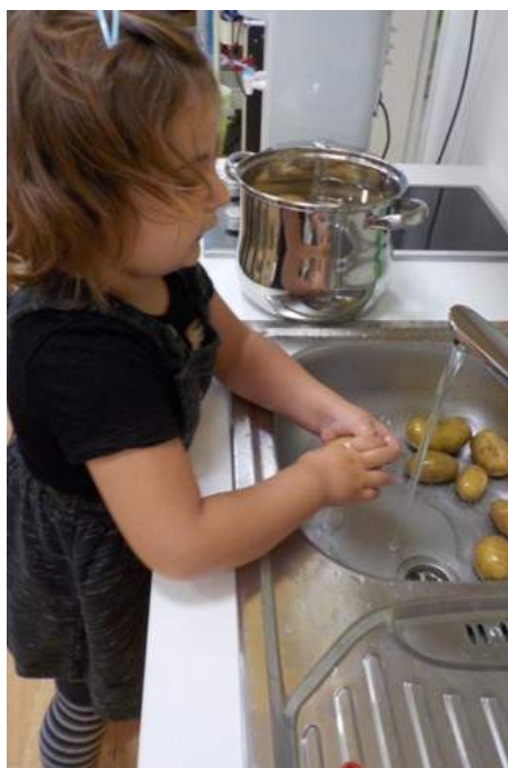
Die Kinder wurden auch heuer wieder von der Familie Rosar zur Kartoffelernte eingeladen und natürlich wurden die Kartoffeln zu den verschiedensten Köstlichkeiten im Kindergarten weiterverarbeitet...