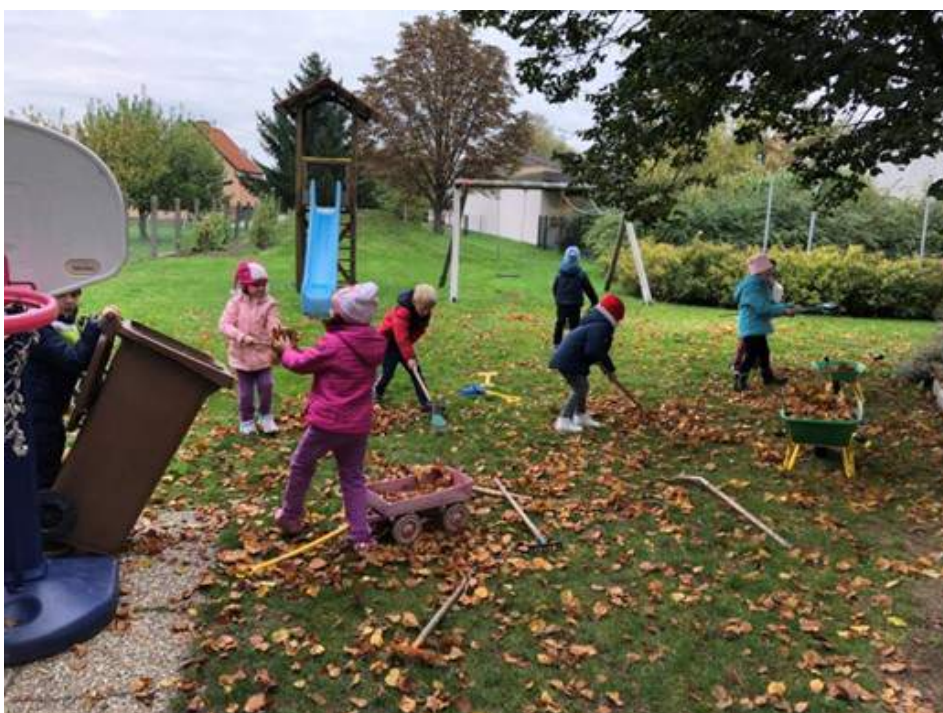
Die Veränderungen in der Natur erleben und das Immunsystem stärken...