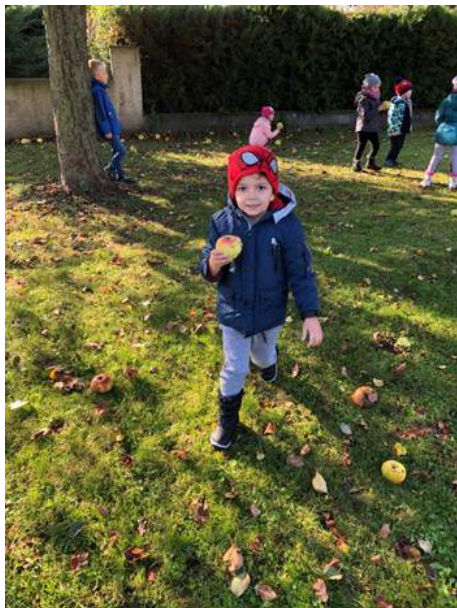
Apfelernte bei der „Schwemm“...