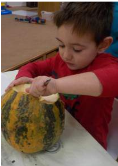
Kürbisse und Zucchini wurden im Garten geerntet...