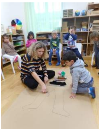
Projekt „Unser Körper“...