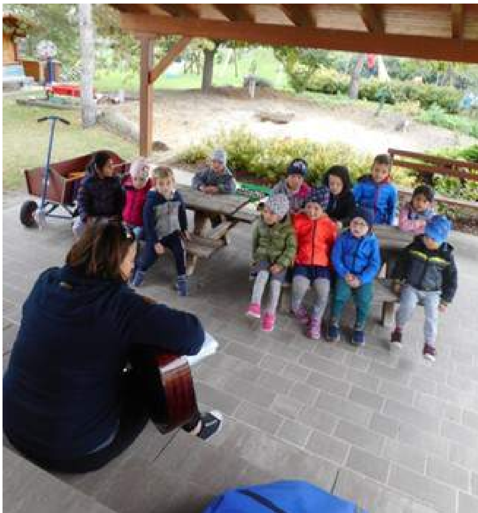
Achtsam leben und gesund bleiben - viele Aktivitäten werden ins Freie verlagert...

Nachfolgend einige Eindrücke aus dem Kindergartenalltag: