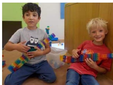
Freude beim gemeinsamen Spiel...