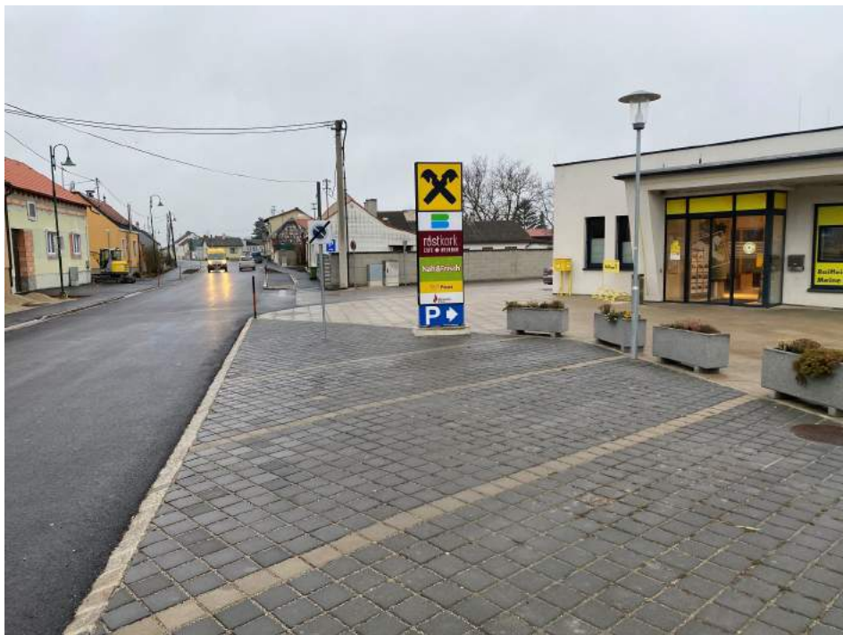
Bushaltestelle Gemeindezentrum

Aus diesem Grund wird der Behindertenparkplatz verlegt. Zukünftig steht der erste Parkplatz, von links aus mit Blick auf das Gemeindezentrum gesehen, für bedürftige Mitmenschen zur Verfügung. Die entsprechende Kennzeichnung folgt.