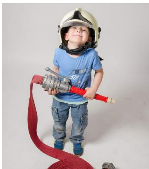
Symbolfoto © pixabay

Im vollständig um- und ausgebauten Feuerwehrhaus der FF Loimersdorf ist nun auch der Raum für die Jugendfeuerwehr fertiggestellt und eingerichtet. Neben einer langjährigen Jugendfeuerwehr hat die FF Loimersdorf seit heuer auch eine Kinderfeuerwehr . Kinder und Jugendliche aus allen Ortschaften sind herzlich willkommen! Für nähere Informationen kontaktieren Sie bitte V Manfred Schwandl unter 0664/3018246, manfred.schwandl@feuerwehr.gv.at, loimersdorf@feuerwehr.gv.at