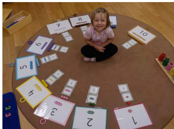
„Das habe ich geschafft“... So viele Zahlen...